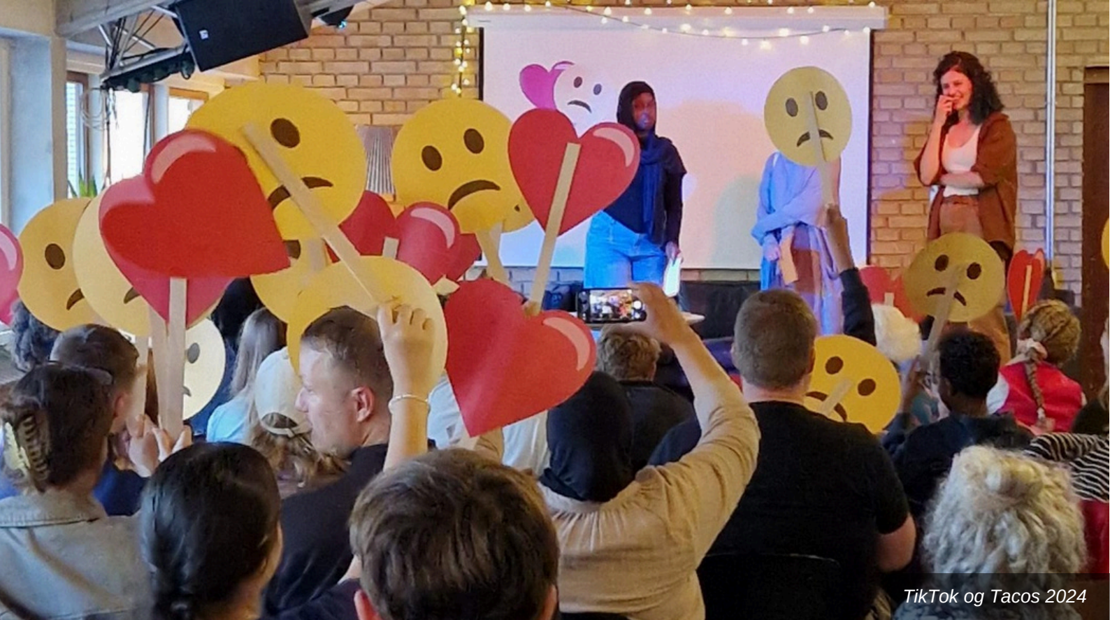
TikTok og Tacos 2024