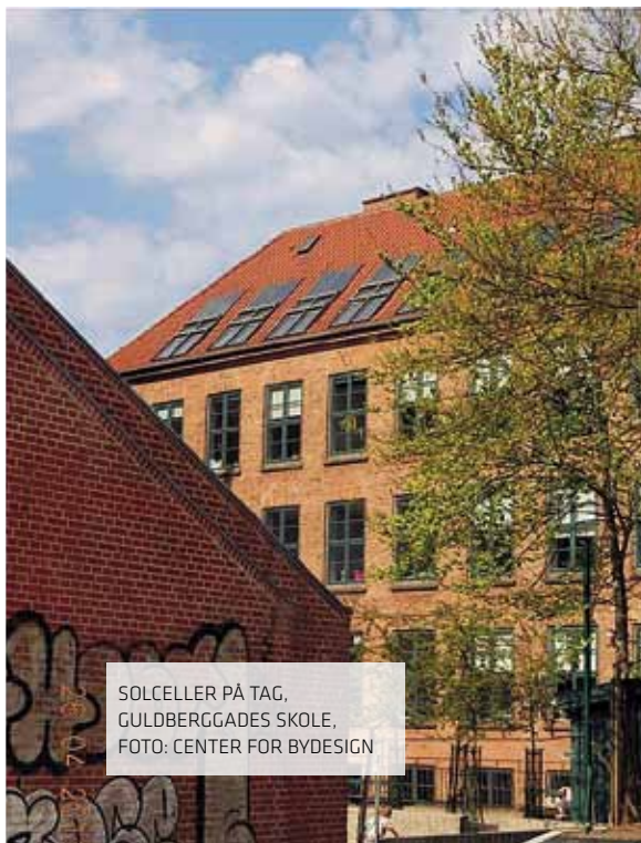
SOLCELLER PÅ TAG, GULDBERGGADES SKOLE