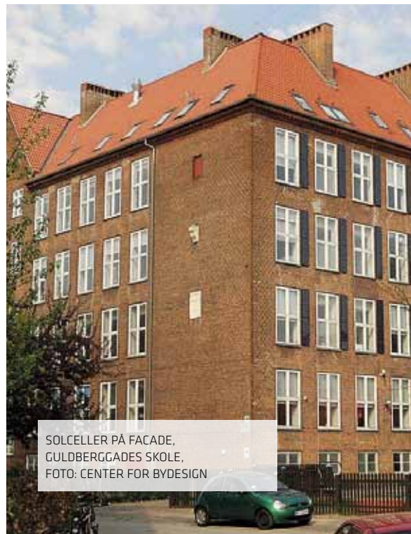
SOLCELLER PÅ FACADE, GULDBERGGADES SKOLE, FOTO: CENTER FOR BYDESIGN