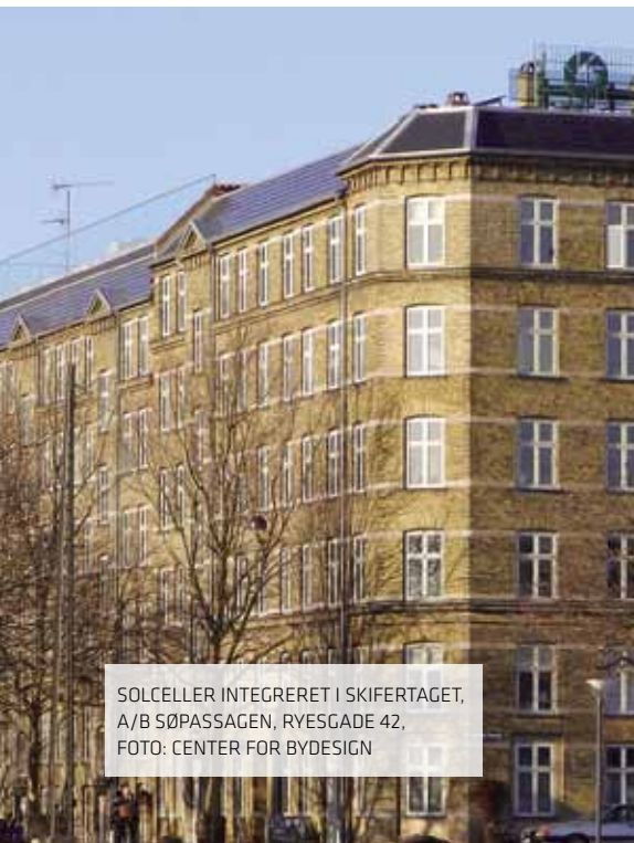
SOLCELLER INTEGRERET I SKIFERTAGET, A/B SØPASSAGEN, RYESGADE 42, FOTO: CENTER FOR BYDESIGN

Vær opmærksom på, om din ejendom er omfattet af en bevarende lokalplan eller særlige servitutter. I så fald kan der være restriktioner,