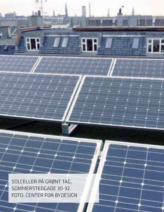
SOLCELLER PÅ GRØNT TAG, SOMMERSTEDGADE 30-32, FOTO: CENTER FOR BYDESIGN