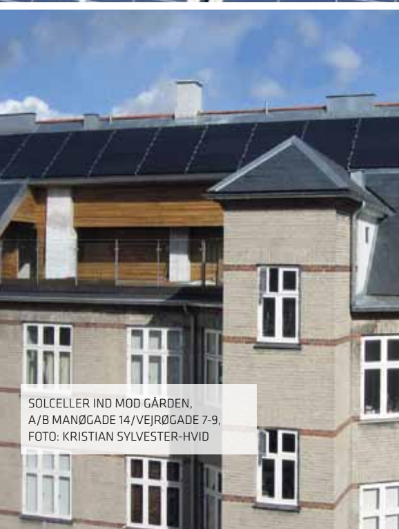
SOLCELLER IND MOD GÅRDEN, A/B MANØGGADE 14/VEJRØGGADE 7-9, FOTO: KRISTIAN SYLVESTER-HVID